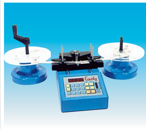
COUNTY con adattatore , supporto Bobina SMD e maniglia COUNTY with SMD tape adaptor, support for rolled bandolier and handle (Cod.8301.018 + Cod.8301.028 + Cod. 8301.030)