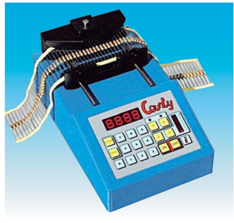
COUNTY lettura componenti radiali e assiali COUNTY radial and axial tape reading

counter for taped axial and radial components