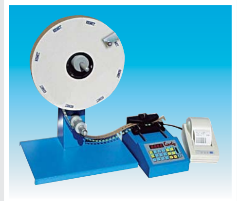
COUNTY con Supporto Bobina, maniglia e stampante COUNTY with support for rolled bandolier, handle and printer (Cod.8301.023 + Cod. 8301.025 + Cod. 8301.090)